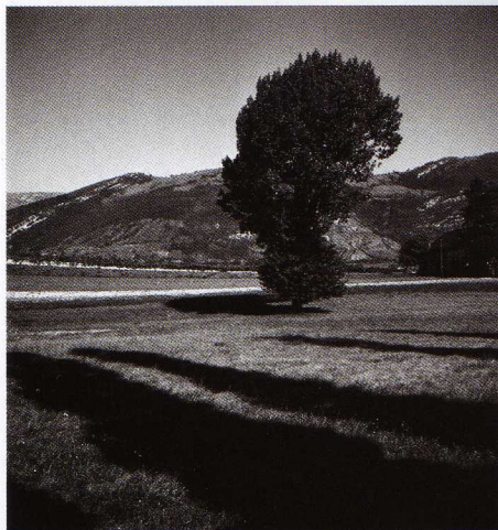
Pierre Jahan. Campagne savoyarde , 1936.